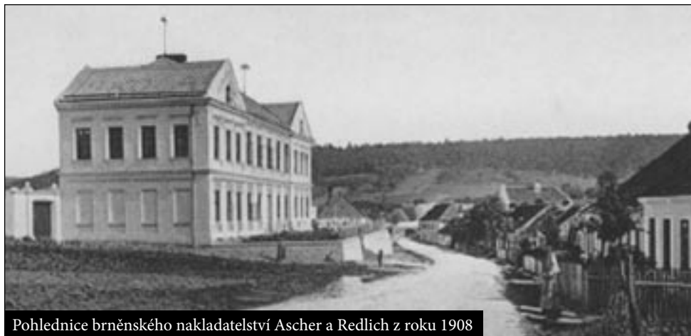
Pohlednice brněnského nakladatelství Ascher a Redlich z roku 1908