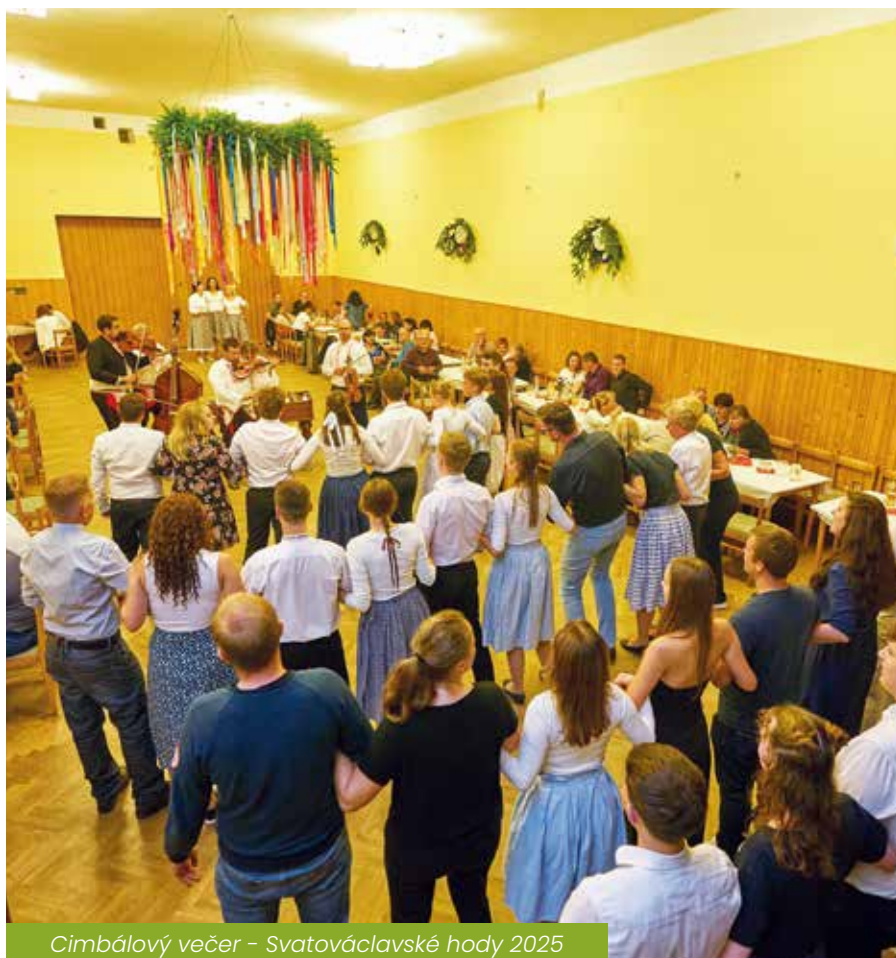
Cimbálový večer - Svatováclavské hody 2025