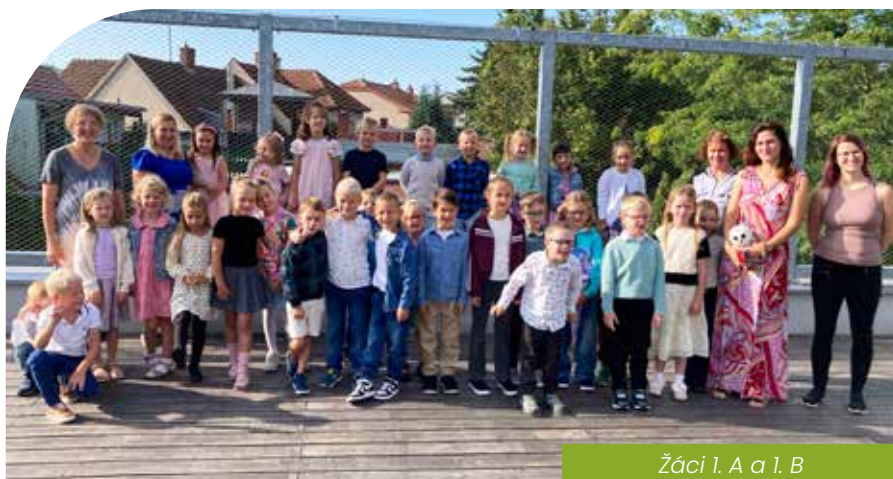
Žáci 1. A a 1. B