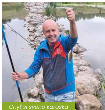
Cht' si svého karáska