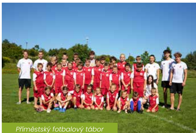
Příměstský fotbalový tábor