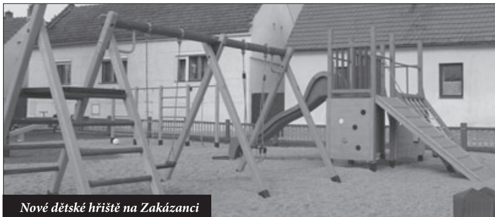
Nové dětské hřiště na Zakázanci