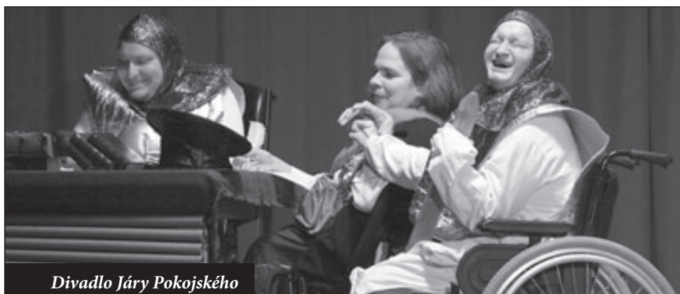
Divadlo Járy Pokojského