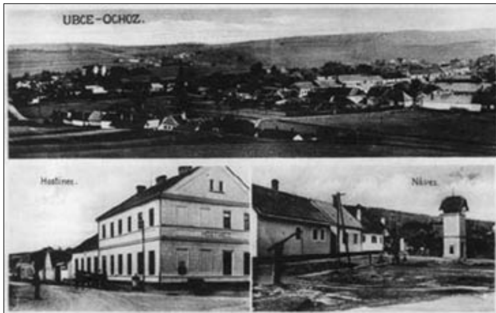
Poled na Ubce a Ochoz, později spojené v jeden celek nazvaný Ochoz u Brna, v roce 1931