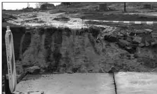
Pohled na staveniště za deště

S jarem se znovu rozeběhla i výstavba na naší stráni. Pracuje tam parta pana Kaliny. Je v ní šest až osm šikovných mládenců, kteří, pokud jsou na stavbě, tak stále pracují, ať už prší, padají kroupy, nebo řadí sněhová vánice. Parta k nám přijela z jižních Čech, z krajiny rybníků. Divili se, že i u Ochoze je rybník, protože z naší krajiny znají jen rozrýpanou zeminu na stráni a její nejbližší okolí.