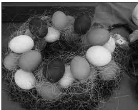
Velikonoční věnec na jarmarku

napečené jidáše nebo velikonoční víno. Někteří se jarmark zalíbil tak, že vydrželi na místě ještě dlouho po jeho skončení.