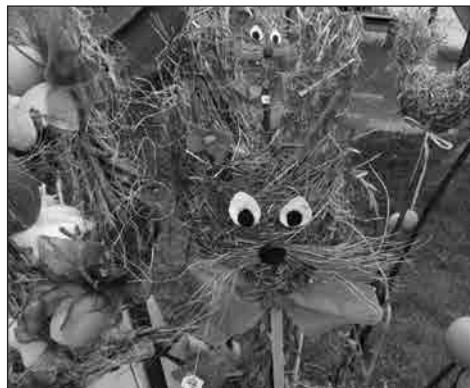
Velikonoční dekorace na jarmarku

scházet, tvořit a vyrábět. U toho jsme samozřejmě stihly probrat i vše důležité a mnohdy došlo i na sklenku dobrého vína. A výsledek? To už nechám na vašem posouzení.