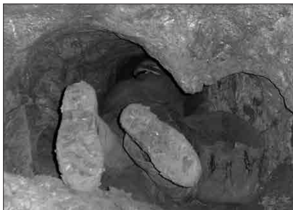
Pohled na začátek Trucchodby

účinkům bláta. Závrt u borovnice je v tomto ohledu milosrdný – nenachází se v něm tekuté bláto, ani jezírka vody, na rozdíl od naší druhé jeskyně. Průstup jeskyní tak zvládne opravdu každý. Na našem skupinovém webu www.SHKB.cz se můžete dočíst termíny akcí a podívat se na reportáže a fotografie z minulých akcí.