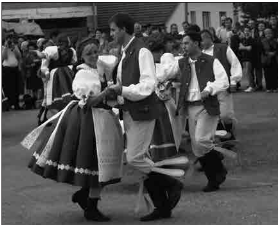
Tanec Kuničky na návsi