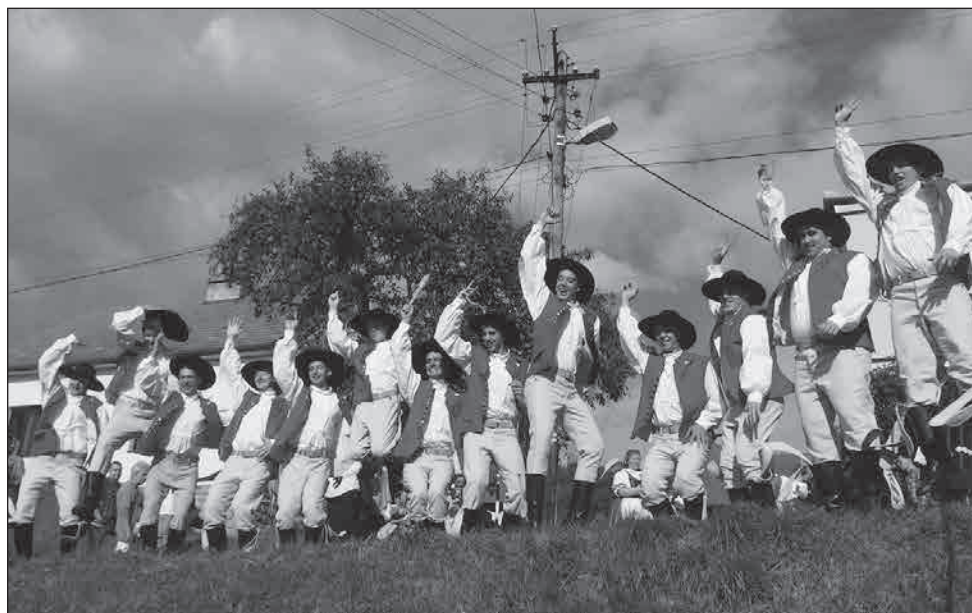
Mužské kroje v akci