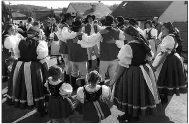
Kolo Za Oborou

Napřed se tancoval tanec klučičí, šavlový, potom holčičí se džbánky a nakonec společný tanec Kuničky z Líšně. Poté průvod přešel na Orlovnu, kde pokračovaly tance a zpěvy pod májů. Zpívalo se jak ve stoje, tak i vsedě. Po celou dobu nás provázela kapela Svatobořáci, které jsme vděční za krásný doprovod. Večer se přidala i cimbálová muzika Líšňáci, při které jsme si pěkně zazpívali. I na večerní zábavě jsme předvedli nacvičené tance v sále Orlovny