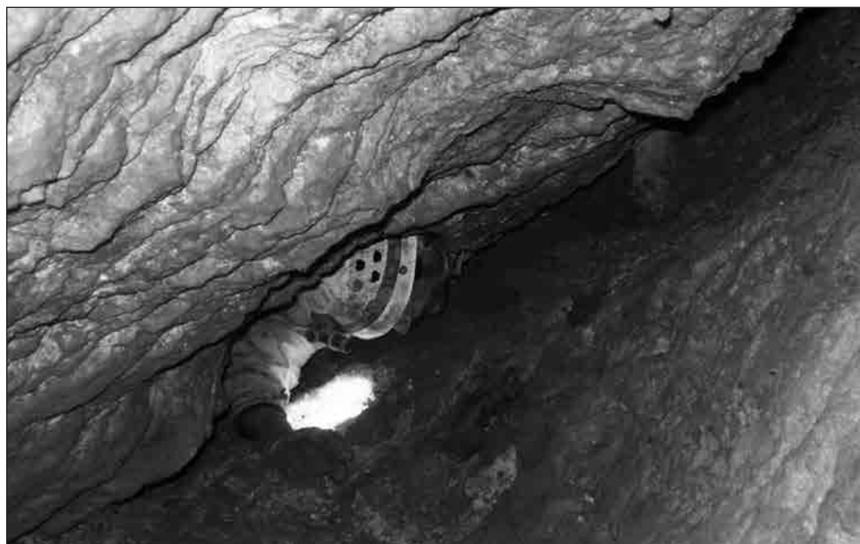
Průzkum úžiny v Jižní propasti