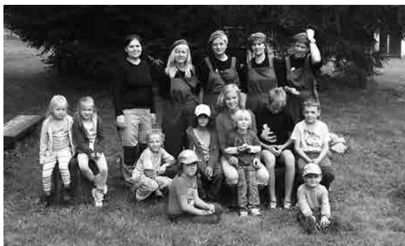
Účastníci vycházky AVZO