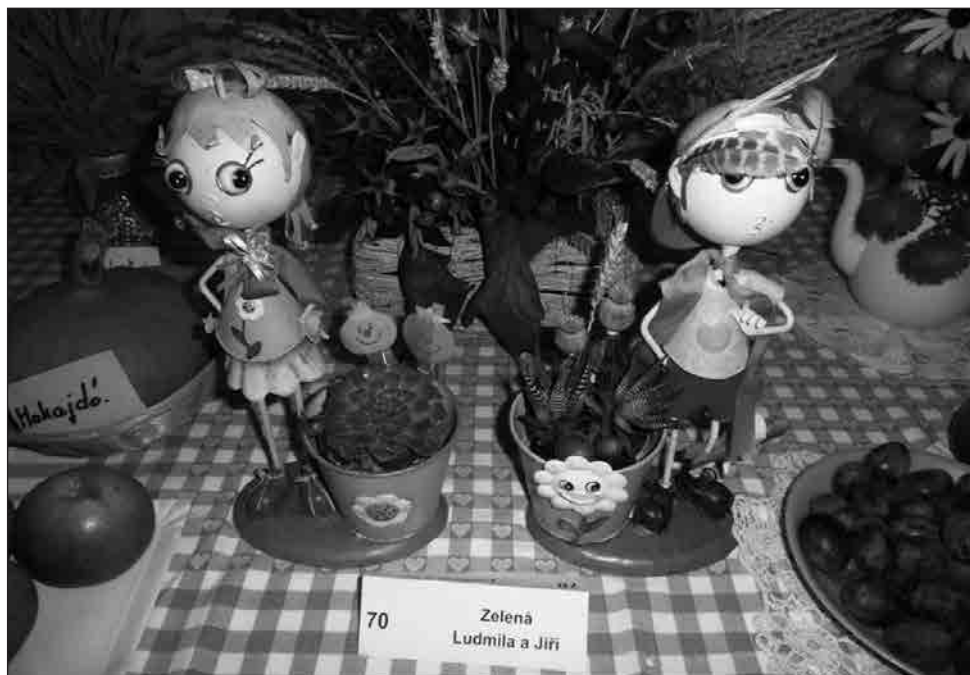
Letošní zahrádkářská výstava

Fyzické a právnické osoby se sídlem v Ochozi – 50% sleva z ceny