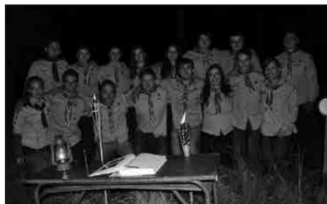
Rověři a rangery na Jelenici