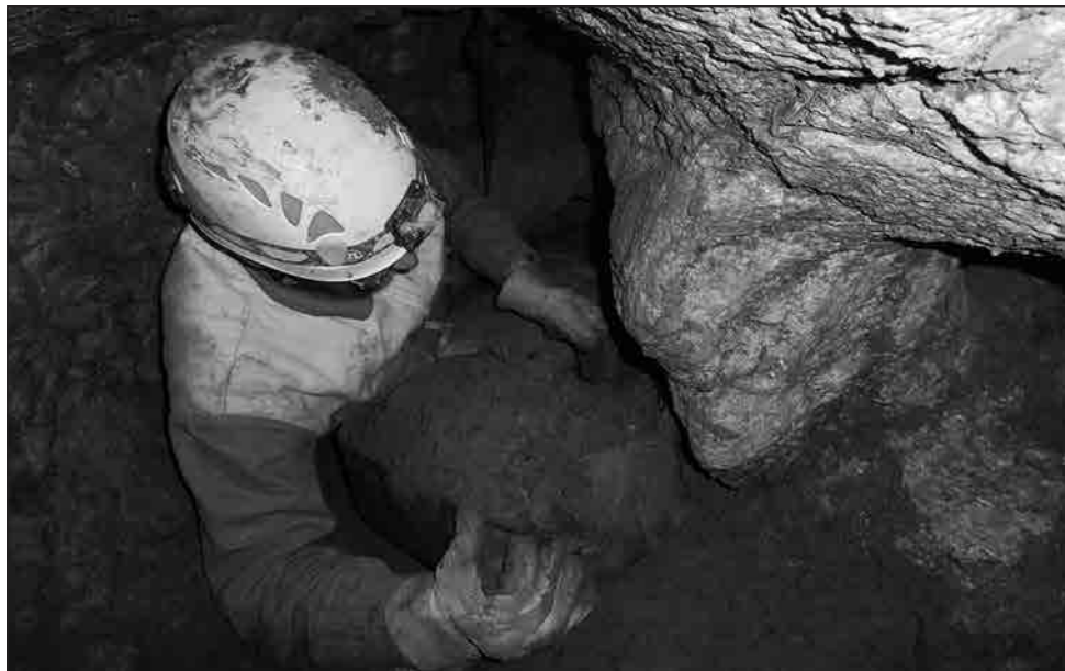
Transport sedimentu v Trucchodbě