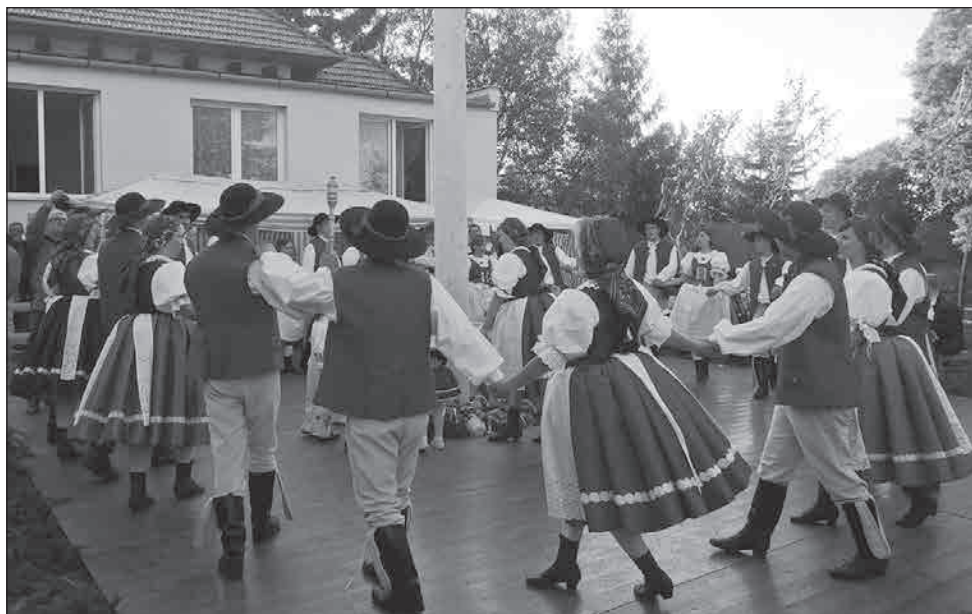
Kolo pod májů na dvoře Orlovny