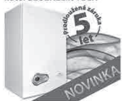
Kondenzační premixový kotel BLUEHELIX TECH