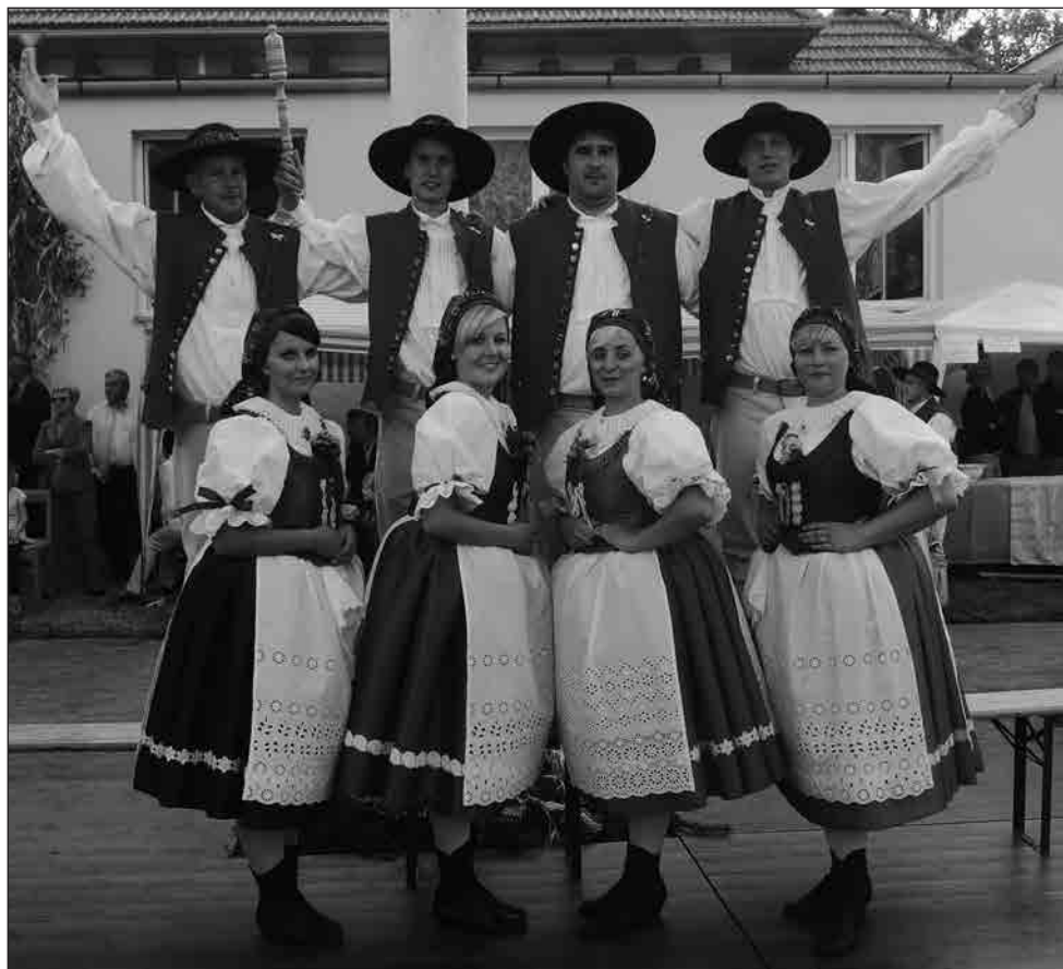
Letošní hlavní čtyři páry.